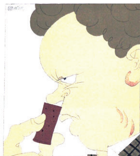
Aan de kurk rieken