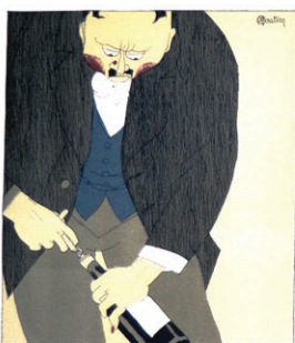
De fles ontkurken